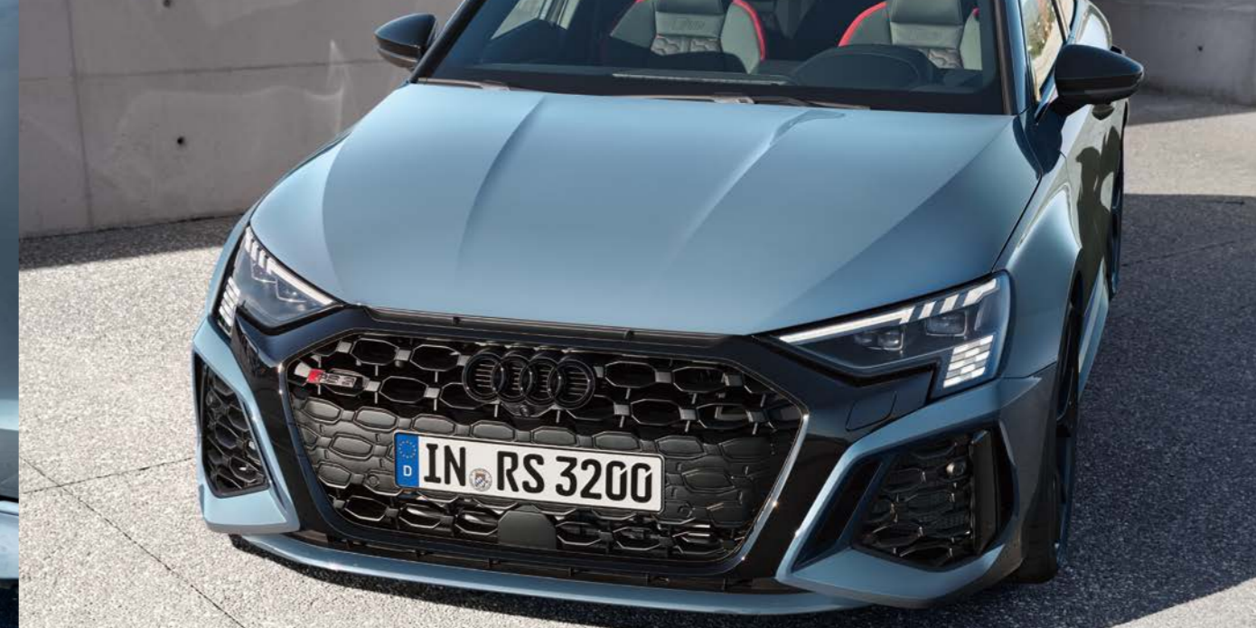
マトリクスLEDヘッドライト ダイナミックターンインディケーター/ブラックAudi rings&ブラックスタイリングパッケージ