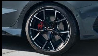
アルミホイール 5スポーク Yデザイン ブラックグラフィックプリント フロント9J×19+265/30 R19タイヤ, リヤ8J×19+245/35 R19タイヤ