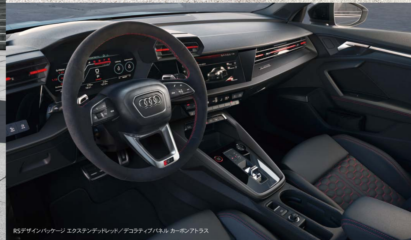
RSデザインパッケージ エクステンデッドレッド/デコラティブパネル カーボンアトラス