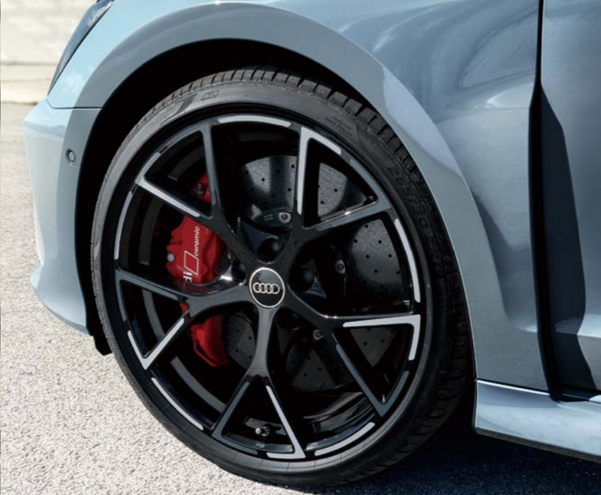
カラードブレーキキャリパーレッド/ アルミホイール 5スポーク Yデザイン ブラックグラフィックプリント フロント9J×19+265/30 R19タイヤ,リヤ8J×19+245/35 R19タイヤ