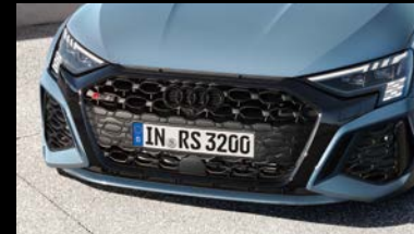
ブラックAudi rings&ブラックスタイリングパッケージ