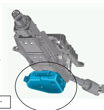
アクセス/スタート認識コントロールユニット