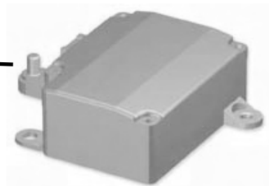
エネルギー管理コントロールユニット