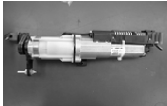
左ドライブユニット