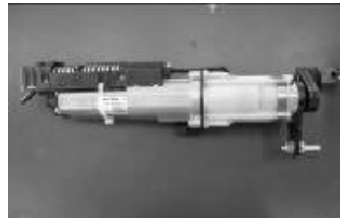
右ドライブユニット