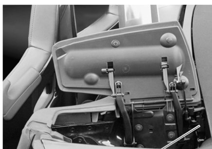
コンバーチブルトップカバーモーター