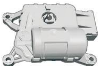
コンバーチブルトップカバーモーター