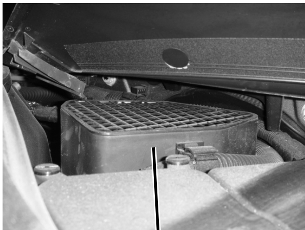
エアインテークダクト