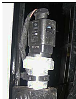
冷媒圧力センサー