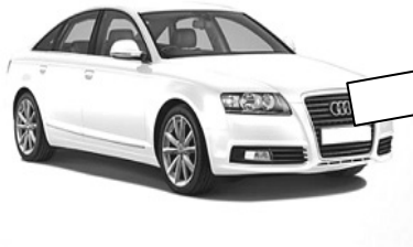
エアバッグ（助手席側装着車両）