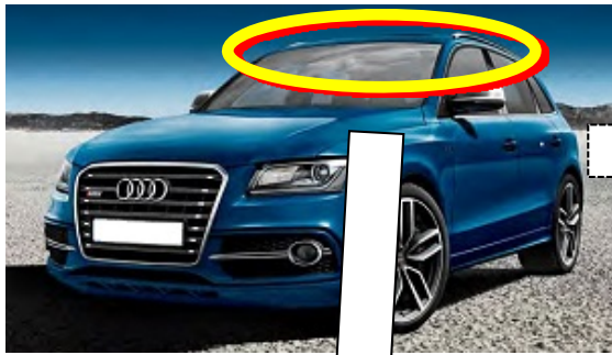
カーテンエアバッグ