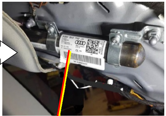
カーテンエアバッグ・インフレーター