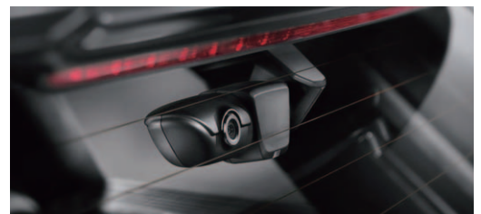
リヤ装着イメージ