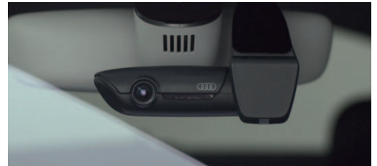
フロント装着イメージ