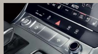
エクステンディッド アルミニウムルック / ブラックガラスルック