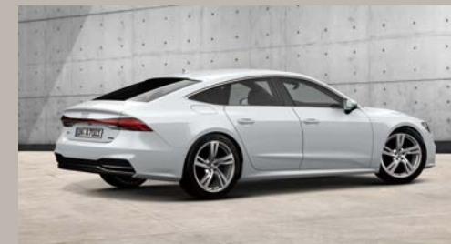
S line エクステリア