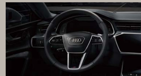
ステアリングホイール 3スポークレザー マルチファンクション