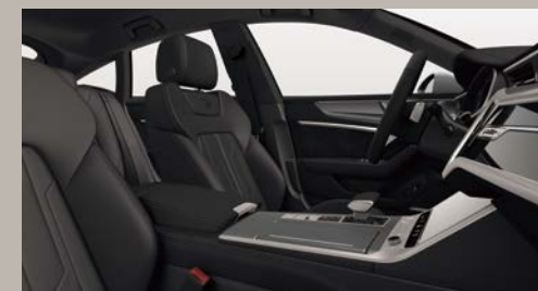
スポーツシート(フロント)/バルコナレザー S line ロゴ