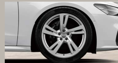
アルミホイール 5ツインスポークデザイン 8.5J×20+255/40R20タイヤ