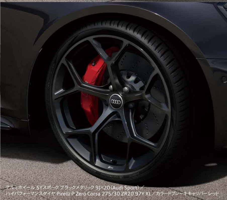
アルミホイール 5Yスポーク ブラックメタリック 9J×20 (Audi Sport) / ハイパフォーマンスタイヤ Pirelli P Zero Corsa 275/30 ZR20 97Y XL / カラーブレーキキャリパー レッド