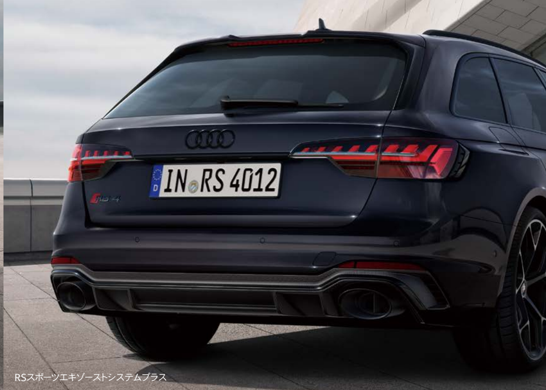
RSスポーツエキゾーストシステムプラス