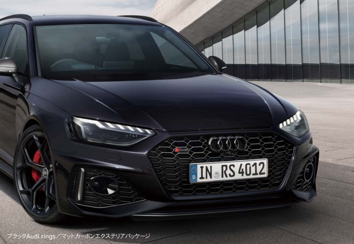
ブラックAudi rings/マットカーボンエクステリアパッケージ