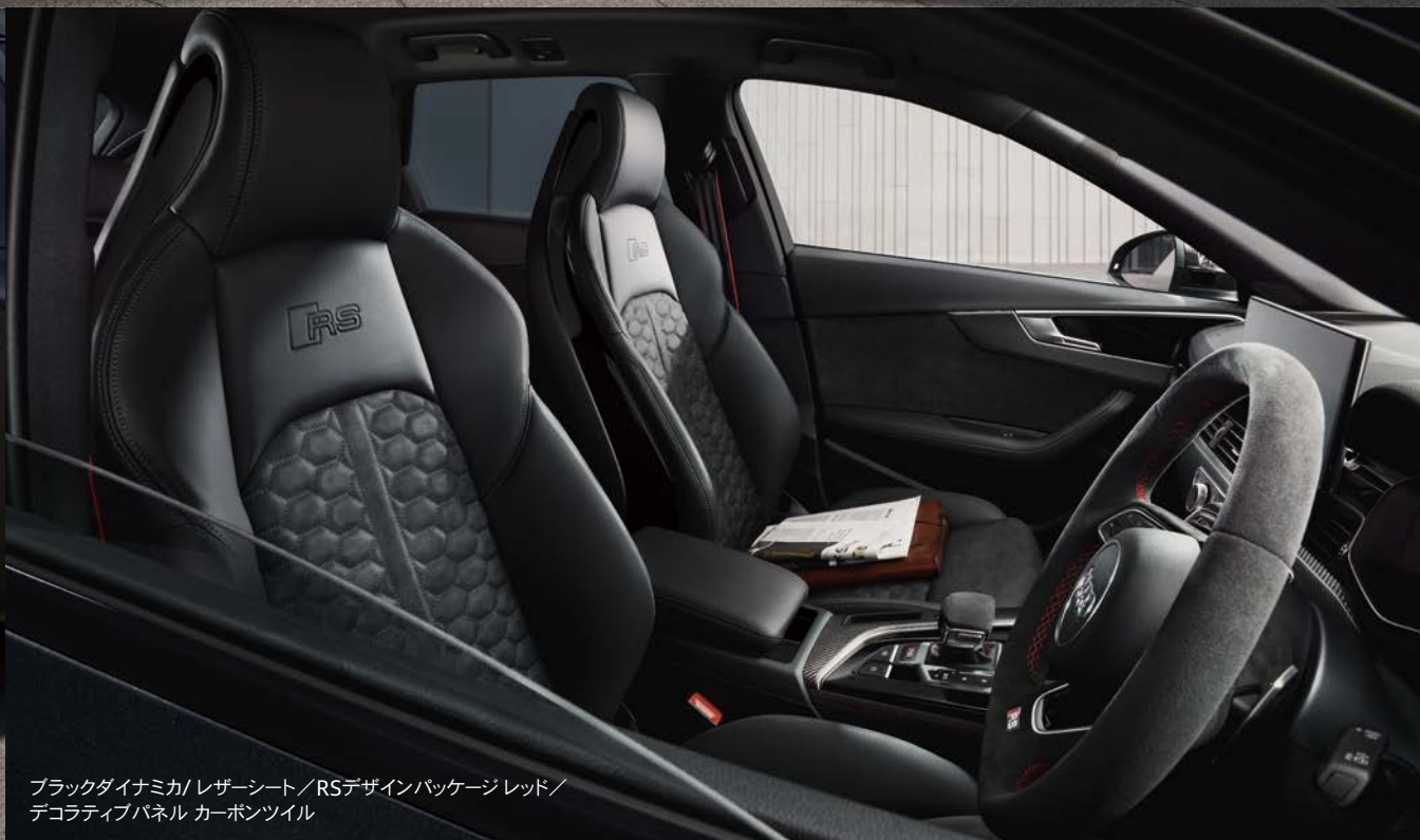
ブラックダイナミカ/レザーシート/RSデザインパッケージレッド/ デコラティブパネル カーボンツイル