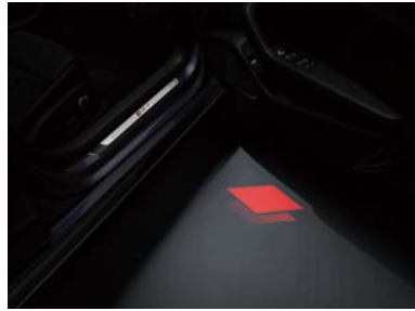
専用ドアエントリーライト“RS competition”

*1 燃料消費率は国土交通省審査値。定められた試験条件のもとでの値です。実際の走行時には、使用環境(気象、渋滞等)や運転方法(急発進、エアコン使用等)に応じて燃料消費率は異なります。