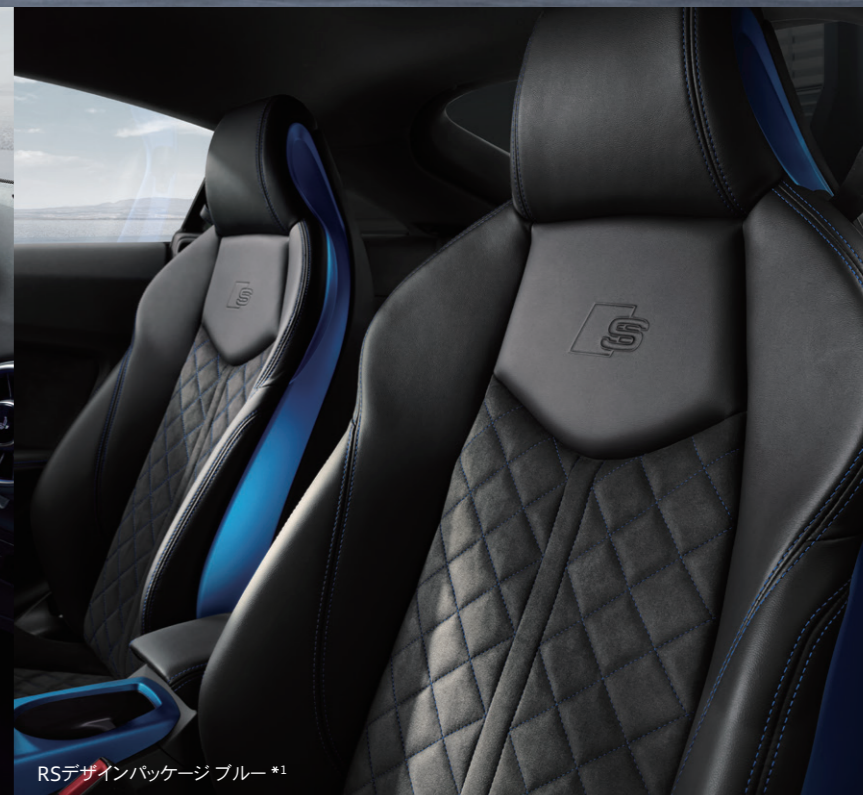
RSデザインパッケージ ブルー *1