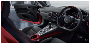
RSデザインパッケージレッド*3/ RSステアリングホイールレッドセンターマーカー*3