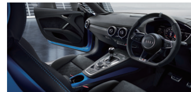
RSデザインパッケージブルー*4/ RSステアリングホイールグレーセンターマーカー*4