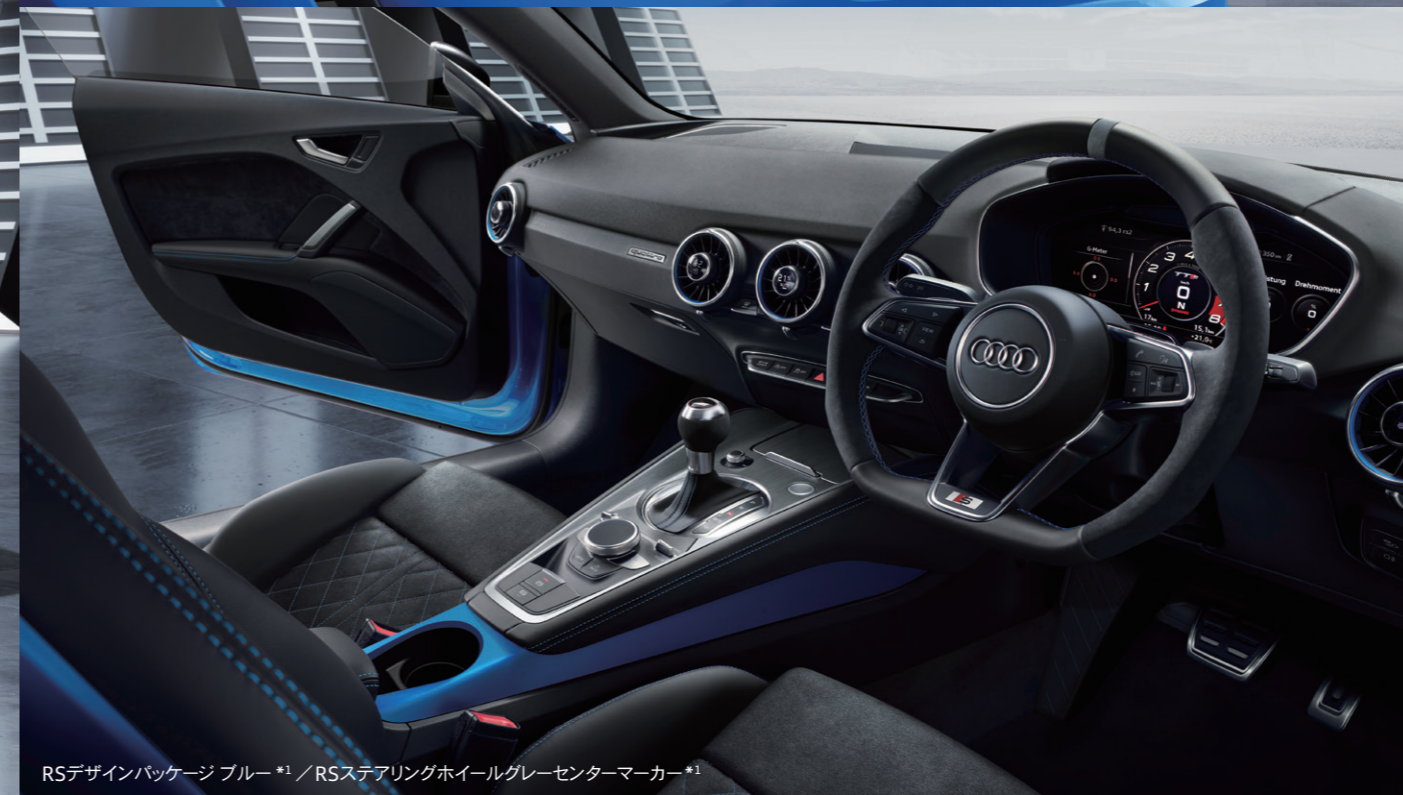
RSデザインパッケージ ブルー *1 / RSステアリングホイールグレーセンターマーカー*1