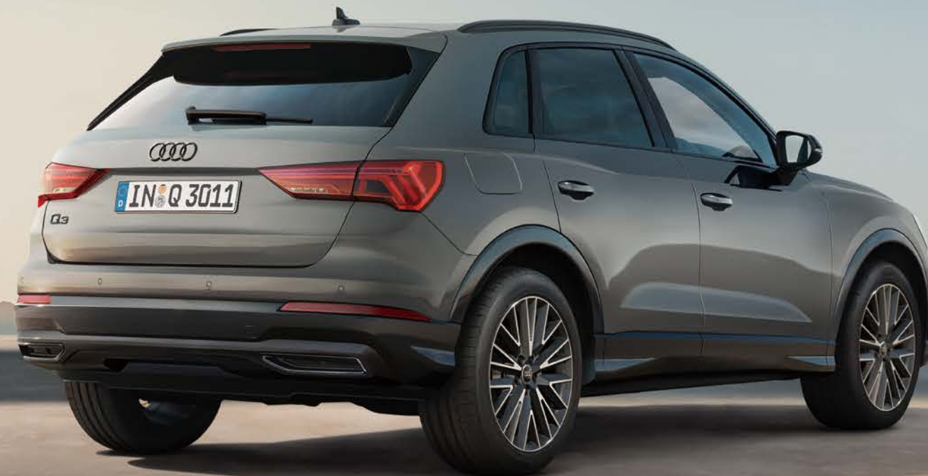
ブラックAudi rings & ブラックスタイリングパッケージ/コントラストペイント マンハッタングレー メタリック