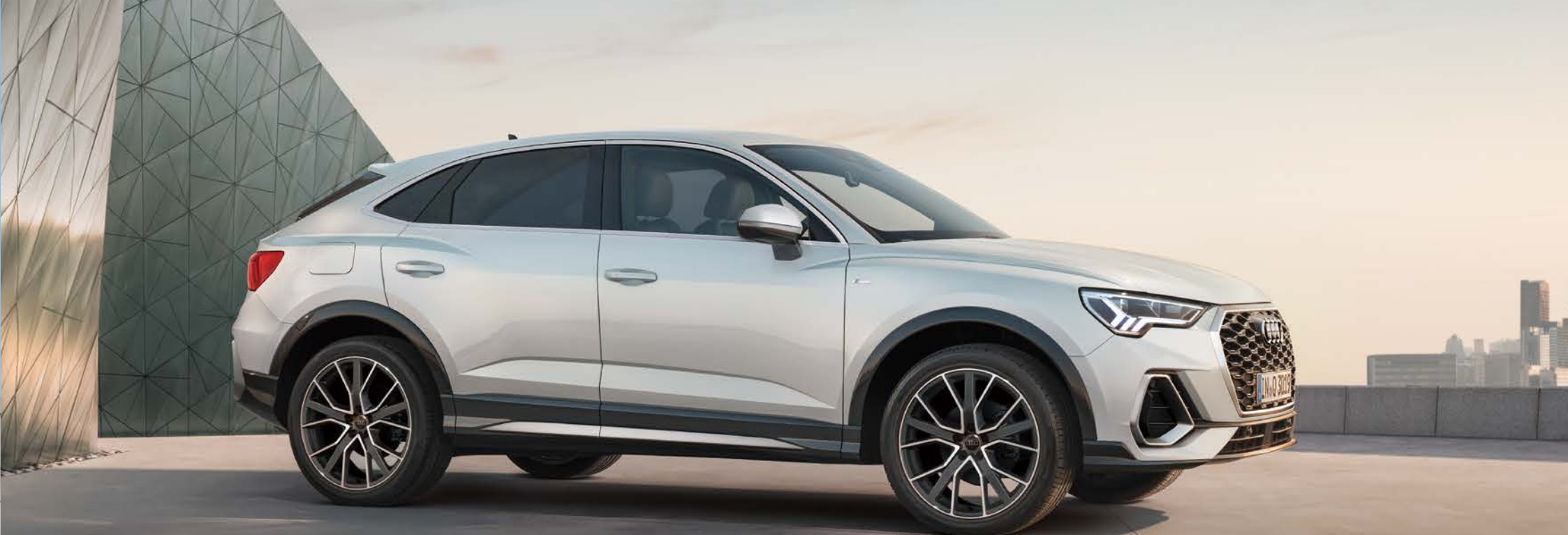
コントラストペイント マンハッタングレー メタリック/アルミホイール5Vスポーク マットチタングレー ポリッシュ8.5J×20 (Audi Sport)+255/40R20タイヤ