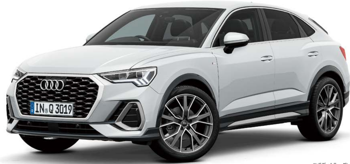
※ボディカラー グレイシアホワイト メタリック