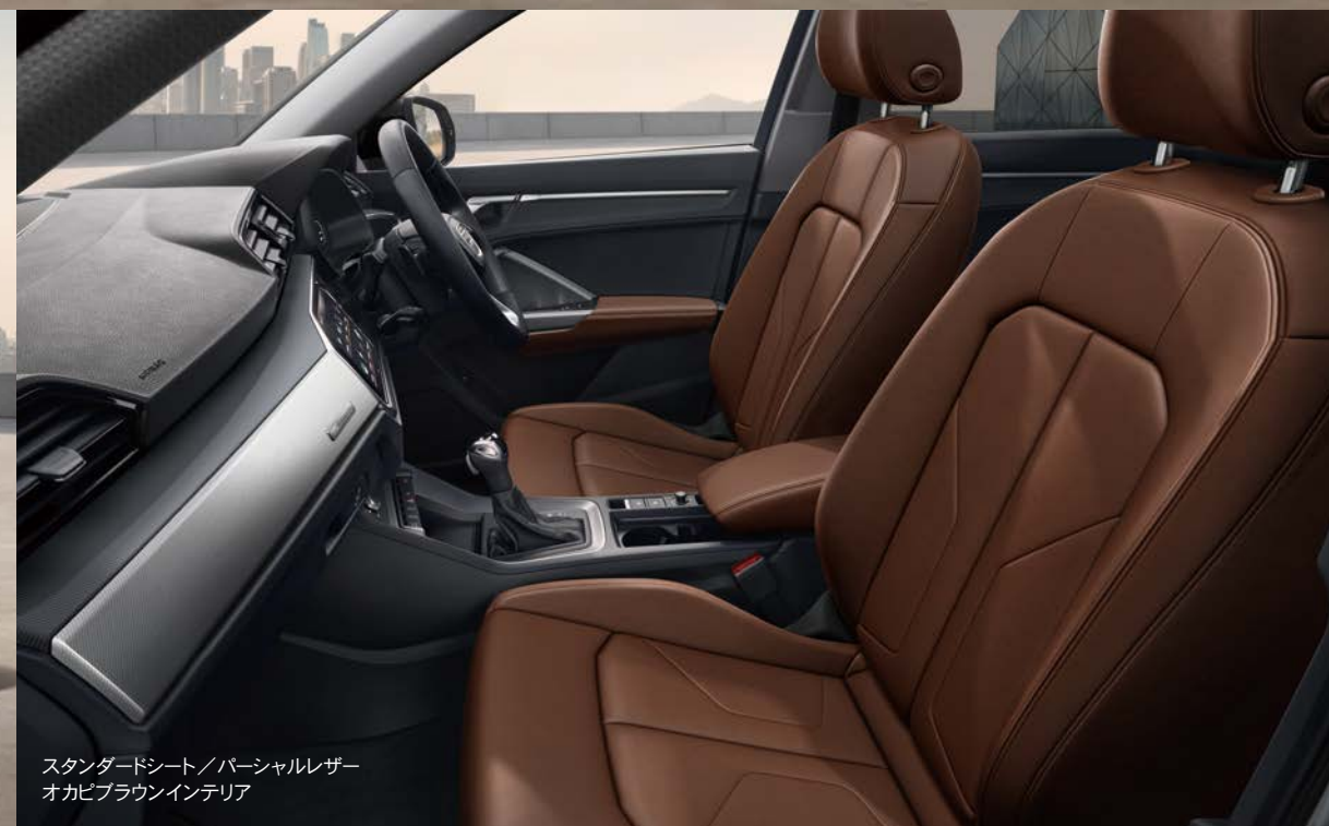
スタンダードシート/パーシャルレザー オカピブラウンインテリア