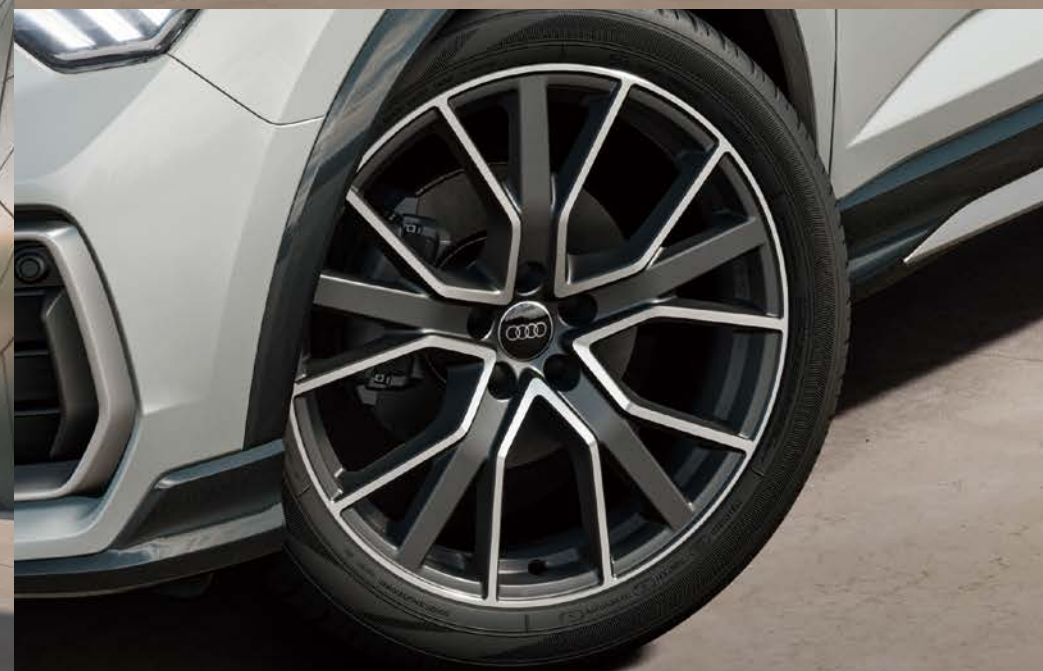
アルミホイール5Vスポーク マットチタングレー ポリッシュ8.5J×20 (Audi Sport)+255/40R20タイヤ