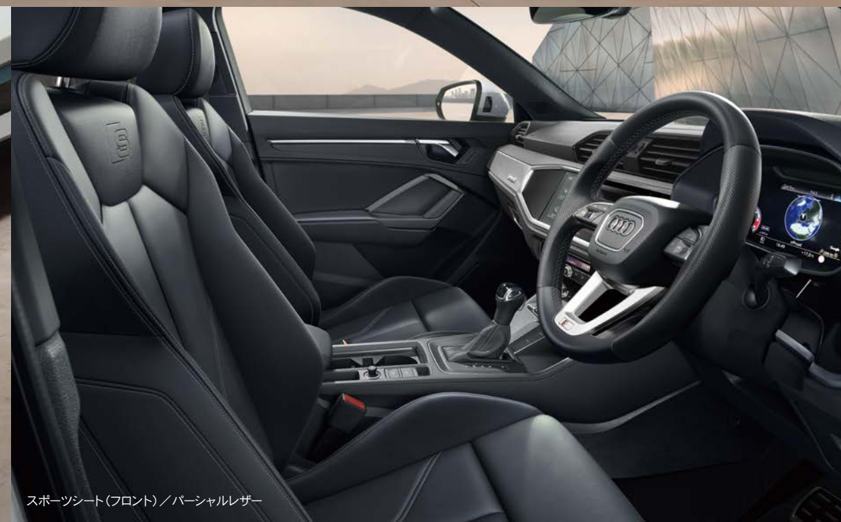
スポーツシート(フロント)/パーシャルレザー