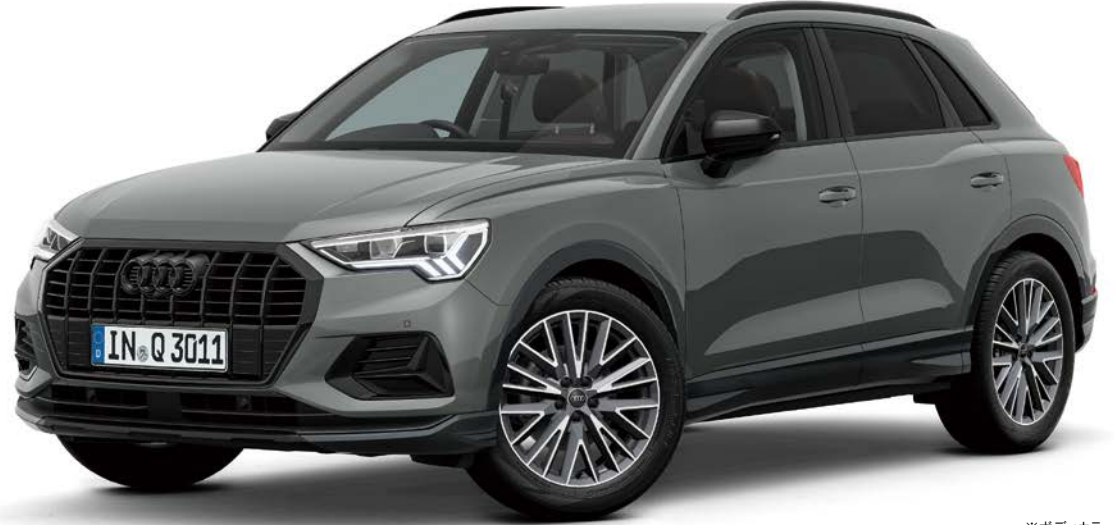
※ボディカラー クロノスグレー メタリック