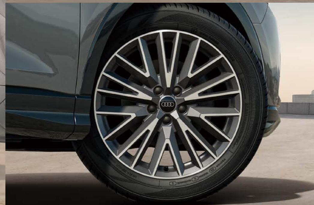
アルミホイール20スポーク グラファイトグレーポリッシュ7J×29+235/50Rタイヤ